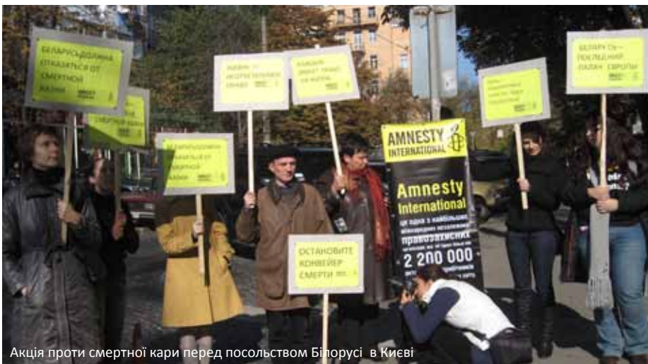
Акція проти смертної кари перед посольством Білорусі в Києві